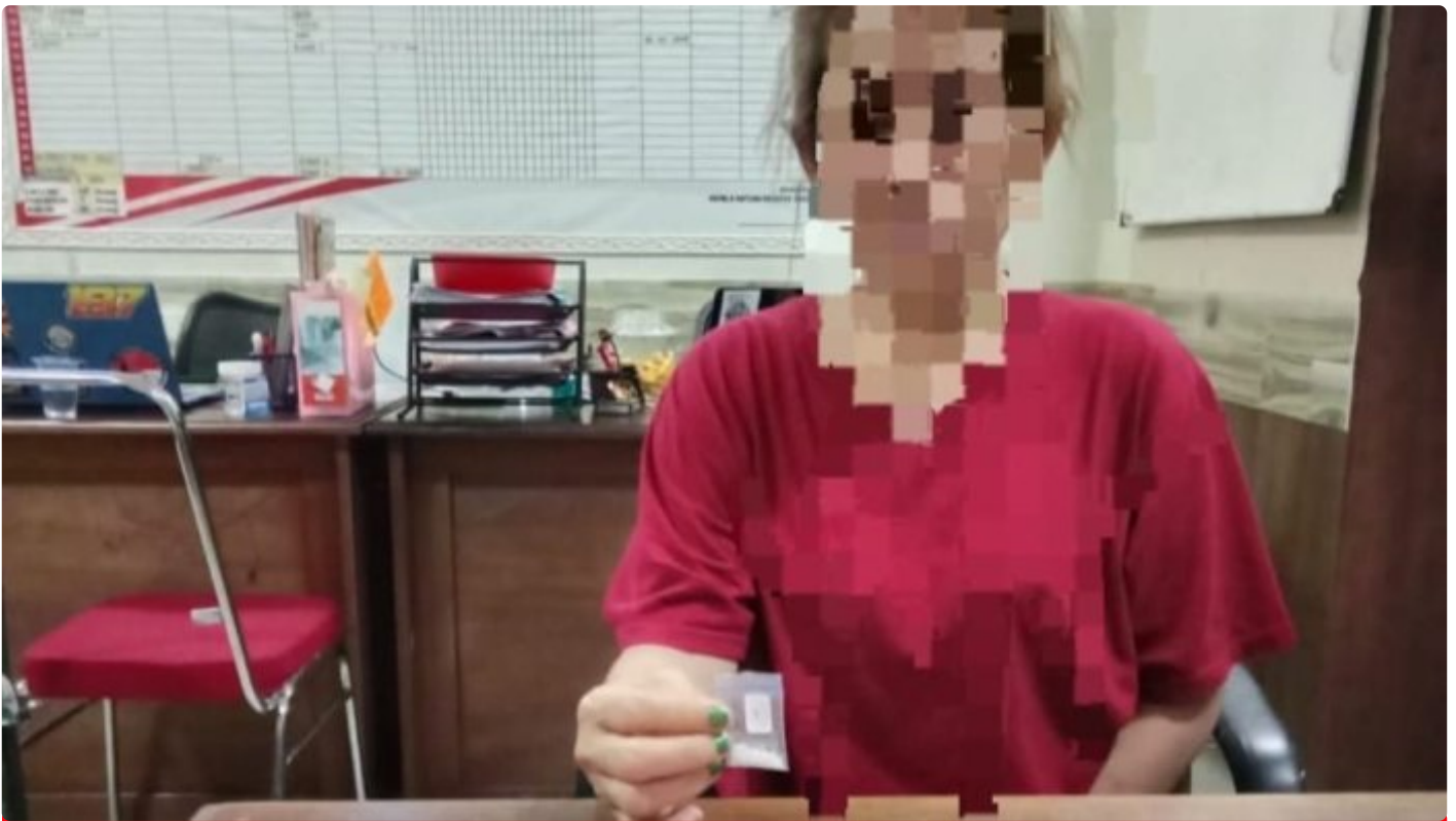
Tampak Salah Satu Tsk Perempuan beserta Babuk Sabu

MOROWALI, Sulawesi Tengah- Satuan Reserse Narkoba (Sat Resnarkoba) Polres Morowali berhasil mengungkap kasus penyalahgunaan narkotika jenis sabu di wilayah hukum Polres Morowali, Provinsi Sulawesi Tengah, di awal tahun 2024 yakni pada hari Rabu, tanggal 3 Januari 2024, sekitar pukul 17.30 Wita.